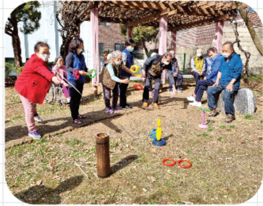
산책 및 말벗