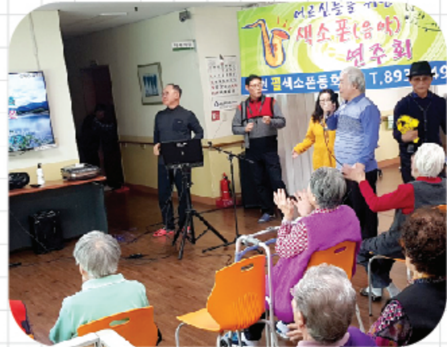
금천 필 색소폰