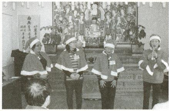
| 후원자·자원봉사자 송년회 |

12월 14일 후원자·자원봉사자님을 모시고 따뜻한 송년회를 했습니다. 봉사단체별로 장기자랑을 하며 서로 인사 나누며 진행된 송년회는 어느때보다 즐거운 분위기로 진행 되었습니다.