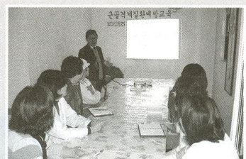
| 직원교육 |

12월 13일 산업안전보건공단에서 내방하여 소방안전교육을 하였습니다. 어르신들 모두 열심히 경청하며 소방안전의 중요성을 다시 느끼는 시간이었습니다.