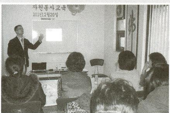
| 자원봉사자 교육 |

11월 30일 ~ 12월 1일 양일간 김장 500포기를 했습니다. 해마다 나와 봉사를 하여 주시는 대한적십자단체에 감사함을 전합니다.