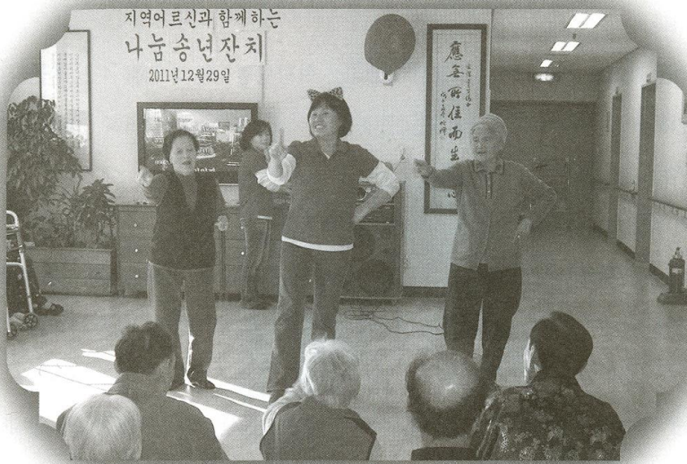
2011년 12월 29일 나눔송년잔치