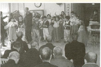
| 시흥초공연 |

11월 23일 산업안전보건공단 주최로 직원들 대상으로 근골격계질환예방교육을 받았습니다.