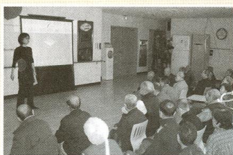
| 소방교육 |

12월 20일 이재학교수님의 강의로 자원봉사자 20여명이 교육을 받았습니다. 노인의 이해와 자원봉사자의 역할에 대한 강의를 들으며 입소어른들을 다른 측면으로 이해하고 생각할 수 있는 기회를 가졌습니다.