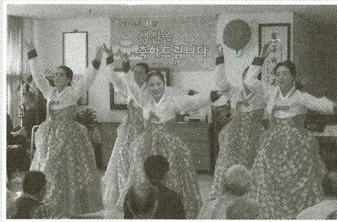
| 생신공연 |

12월 14일 후원자·자원봉사자님을 모시고 따뜻한 송년회를 했습니다. 봉사단체별로 장기자랑을 하며 서로 인사 나누며 진행된 송년회는 어느때보다 즐거운 분위기로 진행 되었습니다.