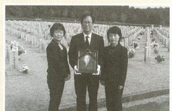
| 대전현충원 |

12월 29일 지역의 어르신들을 모시고 나눔송년회를 했습니다. 맛있는 뷔페음식과 직원이 준비한 다양한 공연을 보며 즐거운 시간을 가졌습니다.