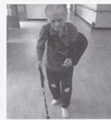
| 물치치료 |

매주 월요일 오후 2시 어르신과 작업치료 시간을 갖고 있는데 7월 둘째 주에 꽃 화분 만들기를 하였다. 화분 꾸미기에 열심히 하시는 어르신들의 모습이 꽃 보다 더 아름답게 느껴집니다.