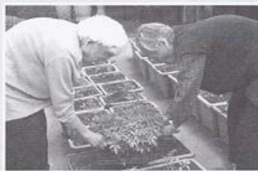
| 마을공동체 활동 |

5월 9일 말벗 봉사단 민들레 모임에서 봄을 맞아 그동안 모임을 가졌던 어르신 8명을 모시고 외식을 하고 물왕리 저수지로 산책을 다녀왔습니다. 맛있는 식사도 하시고 merry 같은 자원봉사자와 손을 잡고 앉아 얘기도 나눠줍니다. 민들레 모임 자원봉사단에 감사드립니다.