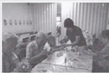
| 작업치료 |

5월 24일 양로원 정원에서 삼겹살 구이를 해드렸습니다. 항상 원내에서만 식사를 하시던 어르신들을 꽃도 피고 공기도 좋은 정원에 모시고 조출하지만 직원들이 직접 삼겹살을 구워서 드리는 시간이었습니다.