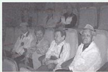
| 어르신 문화나들이 |

5월20일 양로원에 상자 텃밭을 조성했습니다. 200개의 상자에 방울토마토, 상추, 치커리 등정성것 심었습니다. 잘 키워 양로원의 부식으로 사용할 것입니다.