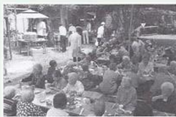
| 삼겹살 데이 |

6월 19일 입소자 가족간담회를 실시했습니다. 많은 가족들이 참석하진 못했지만 가족분들의 다양한 의견을 듣고 양로원 운영 전반에 대해 격식없이 말씀드리는 시간이었습니다. 소중한 시간 내어 주신 가족께 감사드립니다.