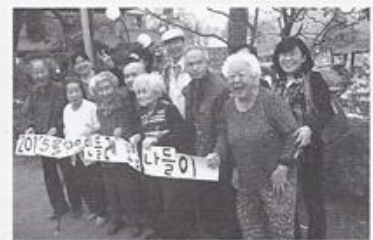
| 민들레모임 나들이 |

4월 26일 어르신 8명이 서울랜드 벚꽃 구경을 다녀왔습니다. 활짝핀 벚꽃을 보며 여유롭게 담소를 나누며 공원을 산책했습니다. 우리 어르신 빨간 조끼를 입은 모습이 벚꽃보다 아름다웠습니다.