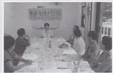
| 제 1회 입소자 가족간담회 |

여성가족부 주최 '어르신 문화 나들이'가 매월 둘째주 금요일에 대방동 여성플라자에서 있습니다. 어르신들이 관람하기 적당한 영화와 식사로 진행되어 인기가 좋은 프로그램입니다. 4월-나는 왕이로소이다, 5월-왕자가 된 소녀들 국극, 6월-진짜진짜 좋아해를 관람했습니다.