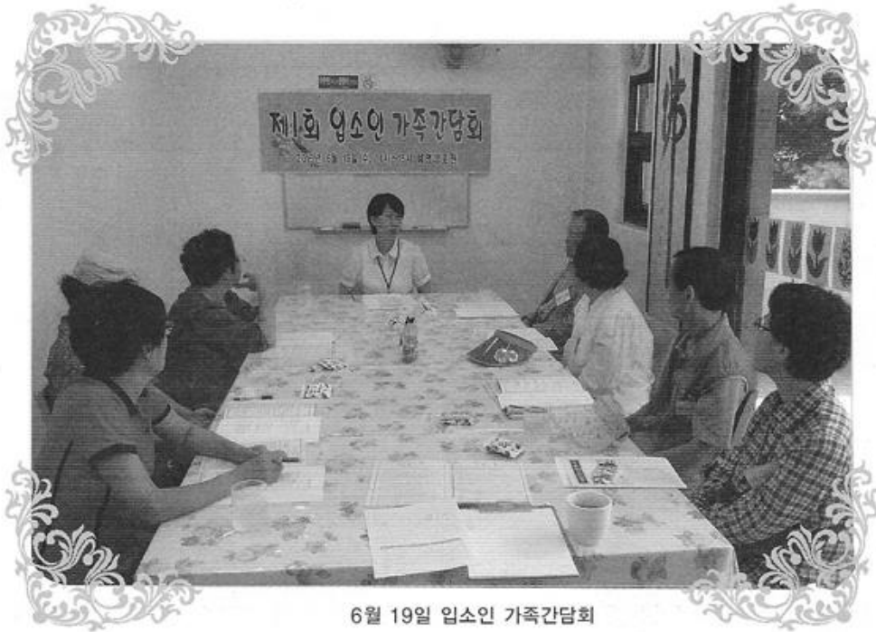
6월 19일 입소인 가족간담회