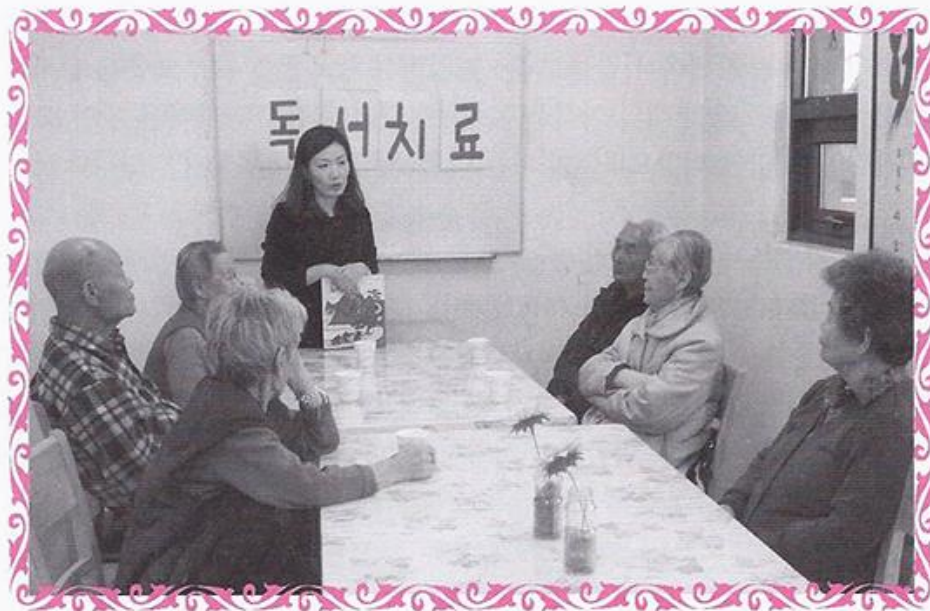
주 1회 독서치료 실시