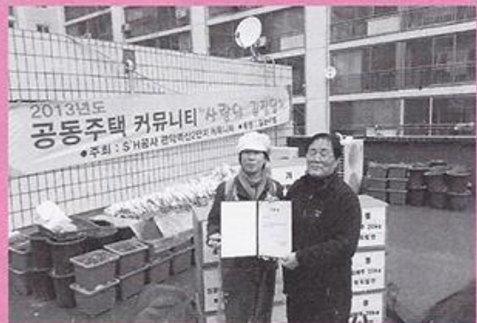
11월15일 시흥2동 벽산2단지 입주자대표회에서 옥상텃밭에서 알뜰히 키운 배추를 절여 200kg을 주셨습니다.