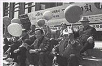
| 서울사회복지협의회 걷기대회 |

매달 셋째주 토요일 구연동화, 스트레칭, 악기연주 등 다양한 공연을 보여주는 알송달송팀은 6월엔 원예치료를 실시하여 입소어르신들에게 색다른 즐거움을 선사해 주셨습니다.