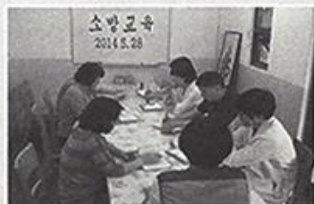
| 직원소방교 |

4월18일 제 10회 서울사회복지협의회 제 10회 걷기대회에 10명의 어르신들이 참석 하였습니다.