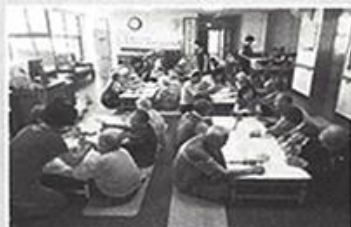
| 알송달송 공연 팀 |

매달 1회 어지르신들 대상으로 이침테라피를 통해 만성질환 관리를 하고 있습니다. 귀 옆 자리를 자극하는 건강관리로 쉽게 처치를 받을 수 있어 어르신들이 무척 좋아 하시고 있습니다.