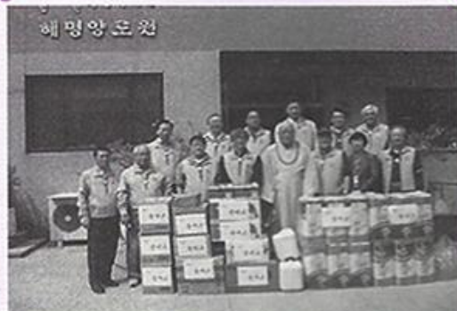
4월13일 용마교동창회에서 방문하여 후원품 전달과 봉사활동을 하여 양로원과 새로운 인연을 맺으셨습니다. 반갑습니다, 자주 뵙겠습니다.