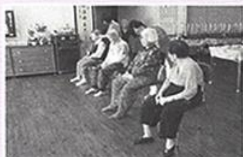
| 이침테라피 |

매달 1회 어지르신들 대상으로 이침테라피를 통해 만성질환 관리를 하고 있습니다. 귀 옆 자리를 자극하는 건강관리로 쉽게 처치를 받을 수 있어 어르신들이 무척 좋아 하시고 있습니다.