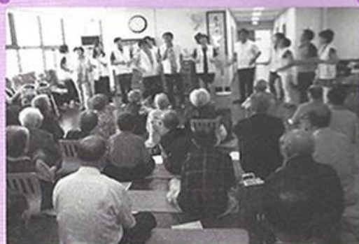
6월14일 탐동초 7기 동창회에서 방문하여 점심공양과 청소, 노래봉사를 하여 어르신들에게 즐거운 시간을 선물해 주셨습니다. 감사드립니다^^