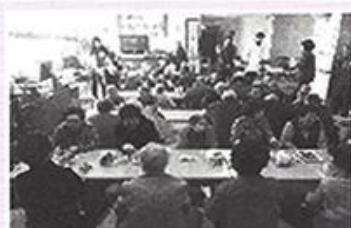
| 영양급식 |

치료가 필요하신 어르신에게 열, 전기, 공기압, 운동치료를 제공하여 통증을 관리하고 재활에 도움을 드리고 있습니다. 보행이 불안정하신 최** 어르신에게 도움이 되는 중둔근 운동을 진행했습니다.