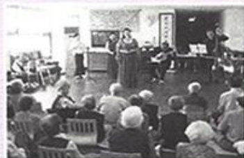
| 한국페스티벌앙상블 공연 |

5월28일 시설화재에 대한 경각심을 갖고 안전한 생활을 유지하고자 직원과 입소어르신들 대상으로 화재안전교육과 모의 훈련을 실시하였습니다.