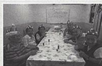
| 미술치료 |

정월대보름을 맞이하여 지역 경로당어르신을 초청하여 척사대회 결승전을 치른 후 간식으로 죽발과 막걸리를 드시며 지역 어르신들과 화목한 시간을 가졌습니다.