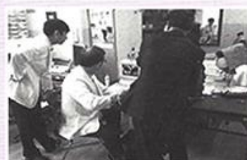
| 생활인 건강교육 |

생활지도원은 치매진단 받은 어르신 중 6명에게 총 12회기로 다양한 미술도구를 활용한 미술치료 활동으로 인지력향상과 소근육활동에 도움을 드렸습니다.