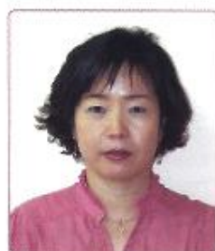
양보금 생활지도원 주임