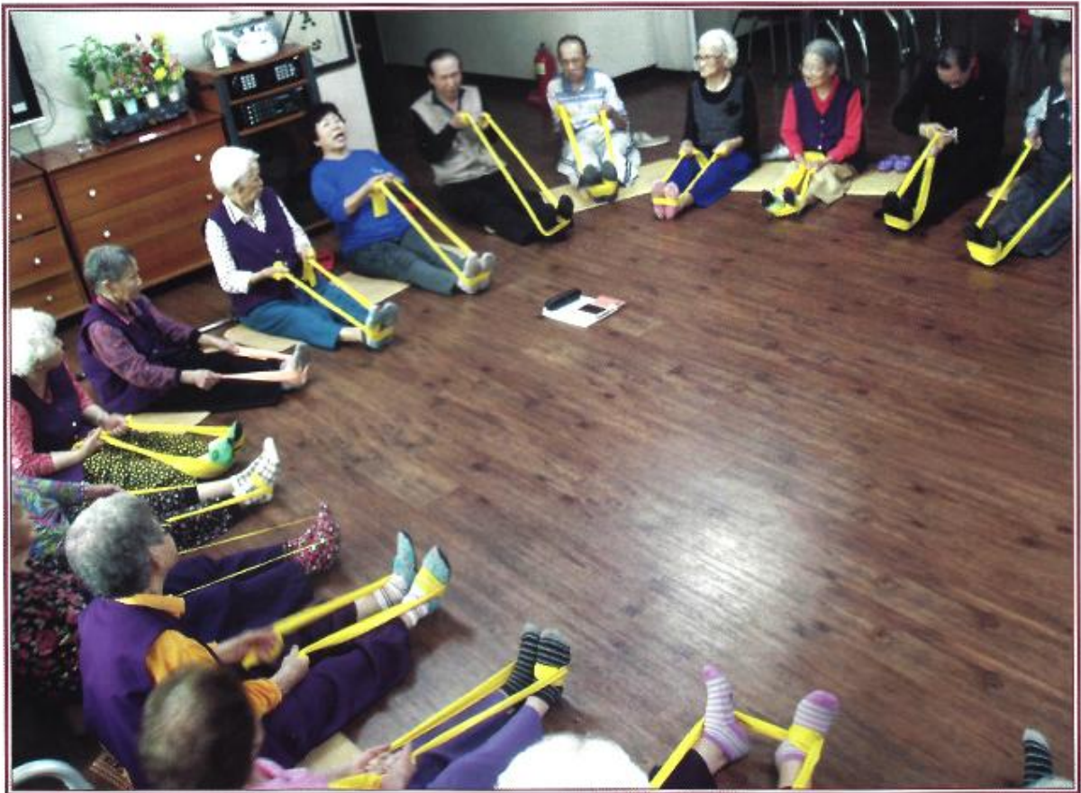
주 1회 25회로 진행된 무지개놀이