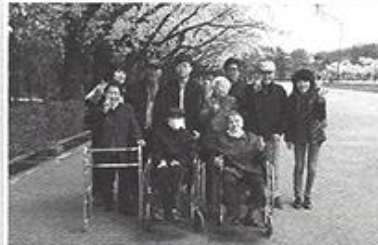
| 서울랜드 벚꽃길 산책 |

4월~6월 미술치료가 10회로 있었습니다. 어르신 6명을 대상으로 그림활동으로 어르신들의 심리상태를 파악하여 원내생활에 안정감을 드리고자 하였습니다.