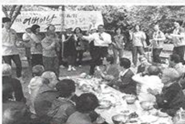
| 제 9회 어버이날 행사 |

2월16일 서대문민주평화통일협의회 여성분과에서 방문하여 어르신들에게 용돈지급과 대중공원 간식 등을 드리며 위로잔치를 해주셨습니다.