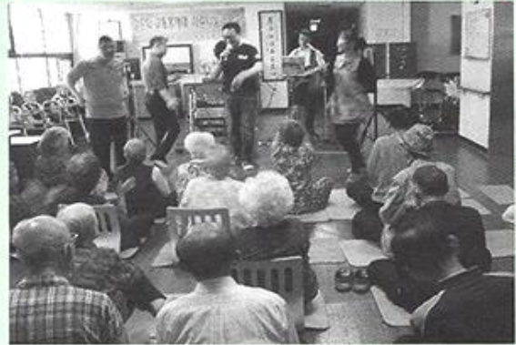
삼운회 교통봉사대 봉사 - 삼운회자원봉사 팀은 2011년부터 매월 1회씩 휴무날 방문하여 어르신들에게 노래와 음악으로 즐거움을 주시고 있습니다.