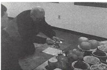
| 설날 "차례지내기" |

3월5일 제 12회 척사대회를 했습니다. 양로원 우승팀이 지역의 산장 경로당 어르신과 결승을 하여 비록 3패를 하였으나 대회를 하는 동안 모두 웃고 떠들며 화기애애한 시간을 가졌습니다.