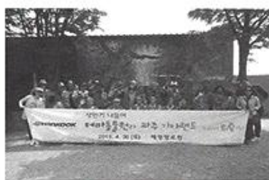
| 상반기나들이 |

5월8일 어버이날을 맞아 양로원과 지역의 어르신들을 모시고 경로잔치를 하였습니다. 맛있는 음식과 풍악으로 모두 즐거운 어버이날을 보냈습니다.