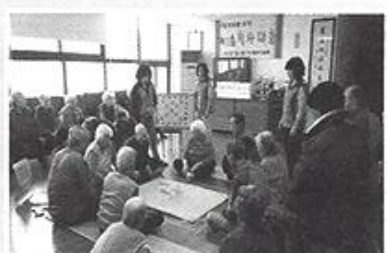
| 척사대회 |

4월30일 일산의 테마동물원 주주와 파주 가야랜드 온천으로 나들이를 다녀왔습니다. 동물들을 근접에서 보며 먹이도 주고 쓰다듬어 보았고 하늘이 보이는 온천탕에서 온천도 즐긴 나들이였습니다.