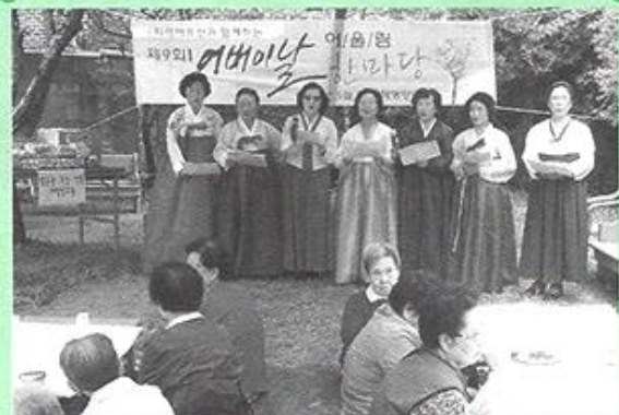
자비나눔예술봉사단 - 5월8일 어버이날에 찬불가 자비나눔예술봉사단이 곱게 한복을 차려입으시고 "어머님 은혜" 노래와 떡을 후원해 주셨습니다.