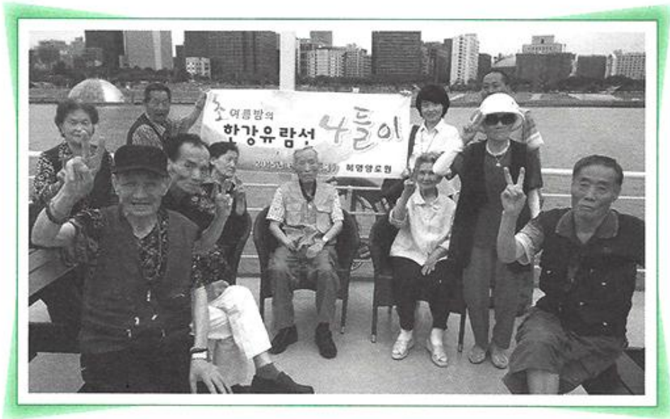
6월 4일 초여름밤의 한강유람선 나들이