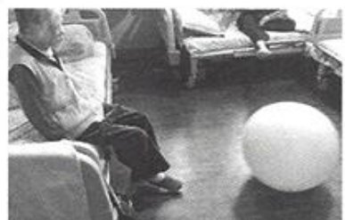
| 물리치료 |

6월2일부터 5일 동안 보건소 건강검진과 치과검진을 진행하여 어르신들의 질병을 조기발견하고 치료하여 건강을 유지 할 수 있도록 하였습니다.