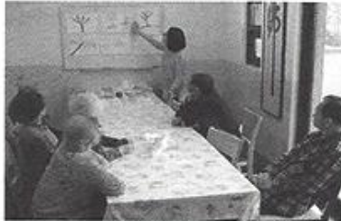
| 미술치료 |

4월~6월 미술치료가 10회로 있었습니다. 어르신 6명을 대상으로 그림활동으로 어르신들의 심리상태를 파악하여 원내생활에 안정감을 드리고자 하였습니다.