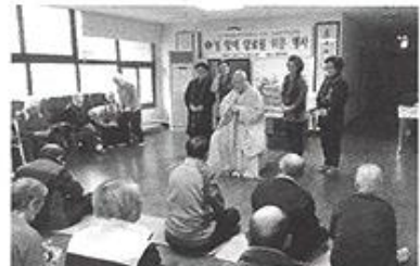
| 서대문민주평화통일협의회 방문 |

4월13일 서울랜드에 벚꽃이 한창일 때 도 시락을 준비하여 산책을 다녀왔습니다. 거동이 불편한 분은 휠체어로 조금 나은 분은 워커를 이용하여 봄날의 기운을 만끽하며 산책을 하였습니다.