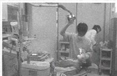
| 보건소 건강검진과 치과검진 |

2월19일 오전 9시30분 법당에서 정성껏 준비한 음식을 차려놓고 양로원어르신들과 직원들이 함께 차례를 지냈습니다.