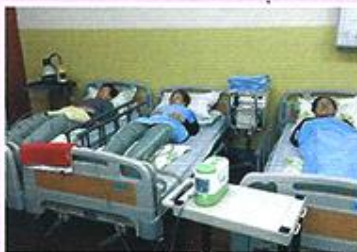
| 물리치료 |

주 5회 관절, 근육에 통증이 있어 생활에 불편함을 가지신 어르신들에게 온열, 전기, 공기압치료를 시행하여 통증을 줄이고 기능회복에 도움을 드리고 있습니다.