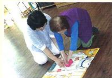
| 어르신 심폐소생술 교육 |

금천구 보건소 결핵 예방 교육을 신청하여 8.25 서북병원 간호사님이 오셔서 교육을 진행하셨습니다. 결핵 예방 교육을 통해 건강에 관심을 가지고 결핵 인식 개선에 도움이 되었습니다.