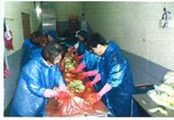
| 김 장 |

7월 20일 음식물 잔반을 줄이기 위한 행사로 남긴 없이 식사를 하신 어르신에게 뽑기를 해 선물을 드리는 행사를 함께하면서 어르신들의 관심을 유도하였습니다.