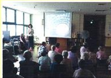
| 건강관리 교육 |

8월 24일 독일 보청기에서 나오셔서 어르신 청력검사를 무료로 진행해 주셨습니다. 검사를 원하시는 분들만 진행하여 13명이 검사하셨고 1명이 보청기를 구입하셨습니다.