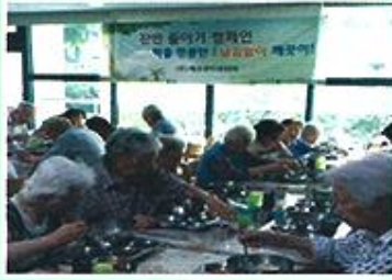
| 잔반없는 날 행사 |

7월 20일 음식물 잔반을 줄이기 위한 행사로 남긴 없이 식사를 하신 어르신에게 뽑기를 해 선물을 드리는 행사를 함께하면서 어르신들의 관심을 유도하였습니다.