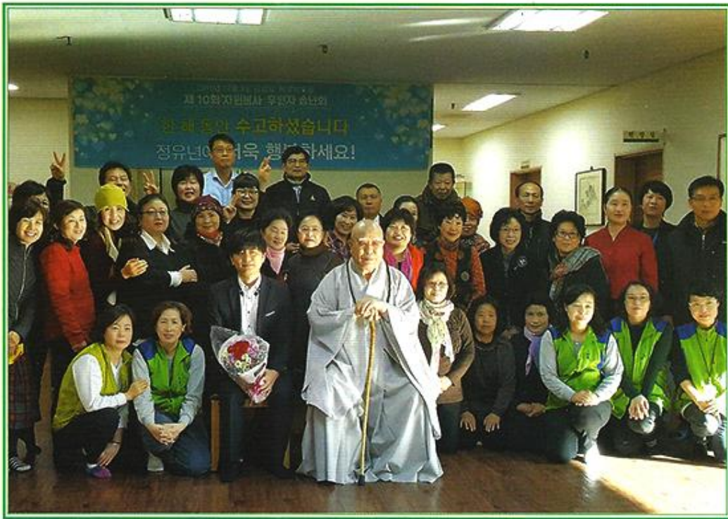
제 10 회 자원봉사 · 후원자 송년회