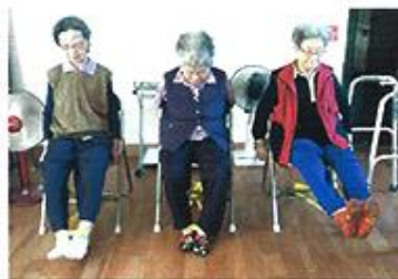
| 관절염 운동치료 |

주 5회 관절, 근육에 통증이 있어 생활에 불편함을 가지신 어르신들에게 온열, 전기, 공기압치료를 시행하여 통증을 줄이고 기능회복에 도움을 드리고 있습니다.