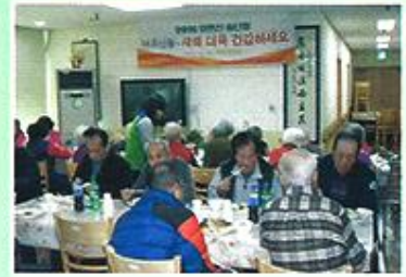
| 어르신 송년회 |

11월 27일 겨울을 대비하여 김장을 하였습니다. 서비스에이스봉사팀과 개인봉사자가 함께 도와주어 무사히 김장을 마칠 수 있었습니다. 간식으로 따뜻한 어묵국물을 준비해드렸습니다. 힘드셨겠지만 모두들 밝게 웃으시며 해주셔서 정말 감사했습니다.