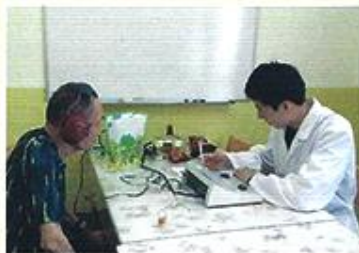
| 무료 청력검사 |

12월 29일 "유역회" 후원으로 어르신들과 함께 송년회를 하였습니다. 음식과 다과를 뷔페로 마련하여 즐거운 식사시간을 가졌습니다. 어르신들이 직접 드시고 싶은 음식을 골라서 드셨고, 몸이 불편하신 분들은 직원들이 가져다 드렸습니다.