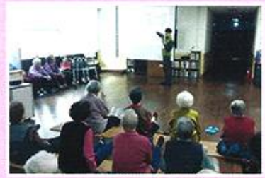
| 낙상예방교육 |

주 1회 무릎관절염이 있어 통증이 심하신 어르신들에게 무릎 주변부위 근육을 강화하여 관절의 부담을 줄여 통증을 줄여드리는 관절염 운동을 진행하고 있습니다.