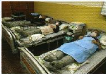
| 물리치료 |

통증이 있으신 분들을 대상으로 온열찜질팩, 전기치료기기, 공기압치료기기를 이용하여 주 5회 증상에 맞는 치료를 해드렸습니다.