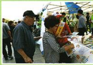
| 금천구사회복지박람회 참석 |

10.26 하반기 나들이로 화성의 하피랜드, 우리꽃 식물원, 피싱피어를 다녀왔습니다. 온천을 하고 식물원에서 가을정취를 느끼며 산책도 하고 서해바다로 가서 바람을 맞으며 활어회를 함께 나눠 드시며 즐거운 시간을 보냈습니다.