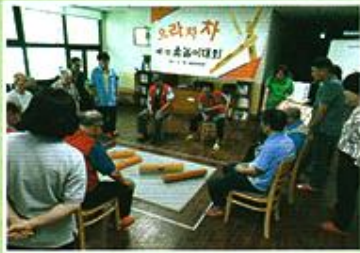
| 제 1회 의랏차차 웃놀이 대회 |

8.29 두 분이 한편이 되어 커다란 웃으로 웃놀이 대회를 하였습니다. 두손 가득 웃을 들고 힘차게 던지며 함께 웃고 떠들썩하니 즐거운 여가시간을 보냈습니다.