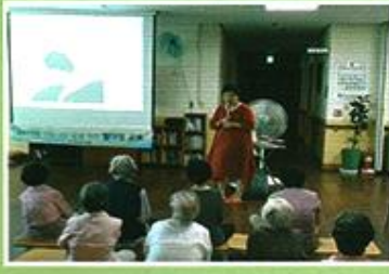
| 웰다잉교육 |

8.29 두 분이 한편이 되어 커다란 웃으로 웃놀이 대회를 하였습니다. 두손 가득 웃을 들고 힘차게 던지며 함께 웃고 떠들썩하니 즐거운 여가시간을 보냈습니다.