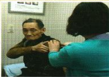
| 독감예방접종 |

1년 동안 수고해주신 봉사자분들을 모시고 감사의 마음을 전달하는 시간을 가졌습니다. 양로원에서 정성껏 마련한 음식과 다과를 뷔페로 준비하여 대접하였습니다.