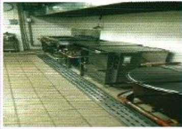
| 조리실 리모델링 |

8월 28일 조리실 리모델링 공사를 하였습니다. 일주일동안 어르신들의 식사에 불편함을 드렸지만 조리실 청결로 안전한 급식과 조리원의 작업환경 개선에 도움이 되었습니다.