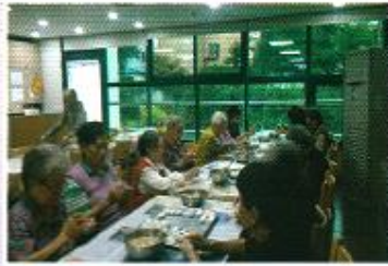
| 만두빚기 |

8월 28일 조리실 리모델링 공사를 하였습니다. 일주일동안 어르신들의 식사에 불편함을 드렸지만 조리실 청결로 안전한 급식과 조리원의 작업환경 개선에 도움이 되었습니다.