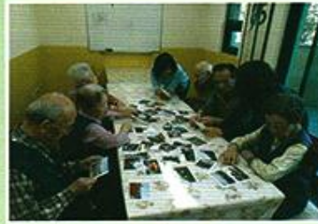
| 회상치료 |

7월 한달에 각당 재단의 지원을 받아 4회에 걸쳐 존엄한 죽음과 아름다운 마무리를 위해 웰다잉교육을 받았습니다. 참여 어르신들과 함께 현재 삶의 가치에 대해 생각하는 좋은 시간이 되었습니다.