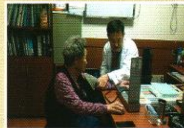
| 병원진료동행 |

11월23일 겨울철 발생하기 쉬운 뇌졸중 응급상황 대처교육을 직원대상으로 진행하여 응급대처 능력을 키울 수 있도록 시청각 교육을 하였습니다.