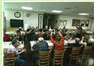
| 치매예방 數활동 |

9.8 금천구의 사회복지기관연합회에서 금천구청 앞에서 사회복지박람회를 개최하였습니다. 우리어르신들도 참석하여 여러 부스에서 다양한 체험을 하며 도장도 받고 기념품도 받으며 함께 하였습니다.