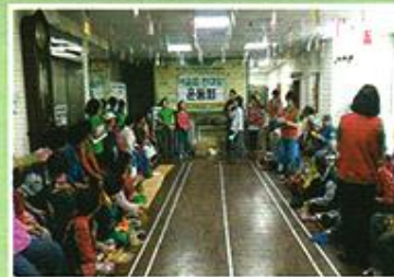
| 노인의 날 기념 어울림운동회 |

12.27 드디어 일 년 동안 모은 쿠폰을 사용하였습니다. 과일, 음료수, 과자 등 다양한 물품과 행복바이러스도 떠들썩하니 함께 파는 혜명장터였습니다.