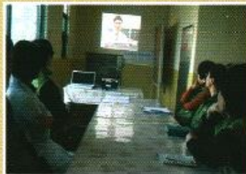
| 응급환자관리교육 |

9월26일부터 75세이상 어르신들의 독감접종이 시작되었고 10월12일에는 65세이상 어르신들의 접종이 진행되어 어르신들의 겨울철 건강관리 및 유지할 수 있도록 하였습니다.