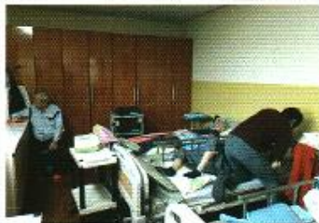
| 기능회복 운동치료 |

통증이 있으신 분들을 대상으로 온열찜질팩, 전기치료기기, 공기압치료기기를 이용하여 주 5회 증상에 맞는 치료를 해드렸습니다.