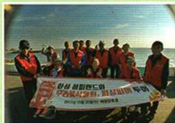
| 하반기 전체나들이 |

9.29 제11회 어울림운동회를 지역 어르신들과 함께 하였습니다. 뛰고, 던지고, 굴리며 힘찬 구호가 양로원에 울려 퍼졌습니다. 어르신들이 늘 오늘처럼 힘차고 활기 넘쳤으면 좋겠습니다.