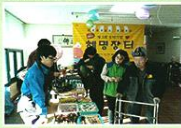
| 송년기념 혜명장터 |

12.20 남자어르신들과 장기대회를 하였다. 참석인원은 적었지만 어르신들의 다양한 욕구를 충족해 드릴 수 있어 긍정적이었다. 내년엔 직원들도 함께 대국하여 더욱 즐거운 분위기를 만들어 드리고자 한다.