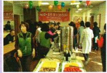
| 자원봉사자송년회 특별식 |

추석맞이로 어르신들이 도란도란 이야기를 나누시며 송편을 빚어 간식으로 드시고 추석차례 상에도 올렸습니다.