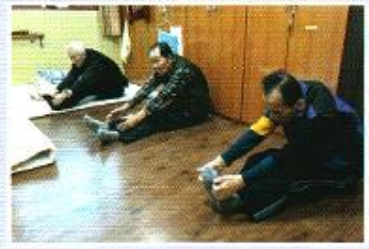
| 관절염운동치료 |

관절의 움직임에 제한이 있거나 근육, 균형에 문제가 있어 기능의 회복이 필요한 분들께서 주 2회 운동치료를 하였습니다.